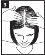
3 Διαχωρίστε τα μαλλιά