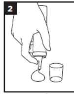
2 Κρατήστε το δοχείο ανάποδα