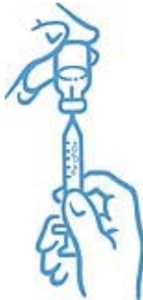
Εικόνα 6: Αφαιρέστε όλες τις φυσαλίδες αέρα και γεμίστε πάλι τη σύριγγα