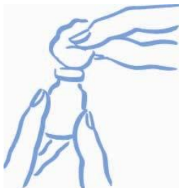
Εικόνα 1: Σκουπίστε το πώμα με αλκοόλη