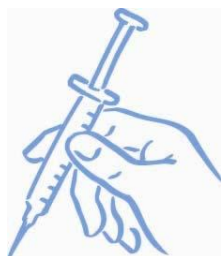
Σχήμα 7: Έτοιμοι για ένεση