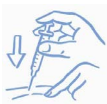
Εικόνα Α: Συσφίξτε ελαφρά το δέρμα και κάντε την ένεση σύμφωνα με τις οδηγίες