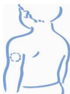
Άνω τμήμα του βραχίονα